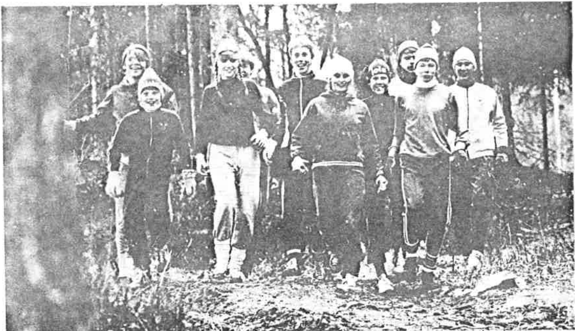
SOK:s framtid under värträning