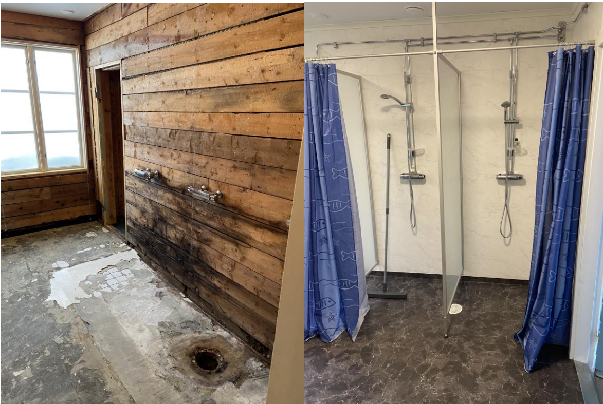
Foto herrarnas dusch under renoveringen och efter.