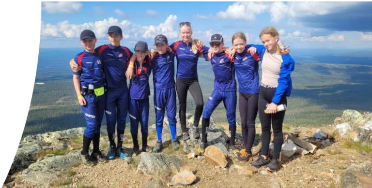
Deltagarna vid Riksläget. Här på toppen av Stådjan i närheten av Idre.

Ungdomssektionen har haft ett bra år med en växande verksamhet framför allt vad gäller tävlingsdeltagande och deltagande på distriktsaktiviteter som läger och tävlingsresor. Följande träningsgrupper har varit i gång med ledare: